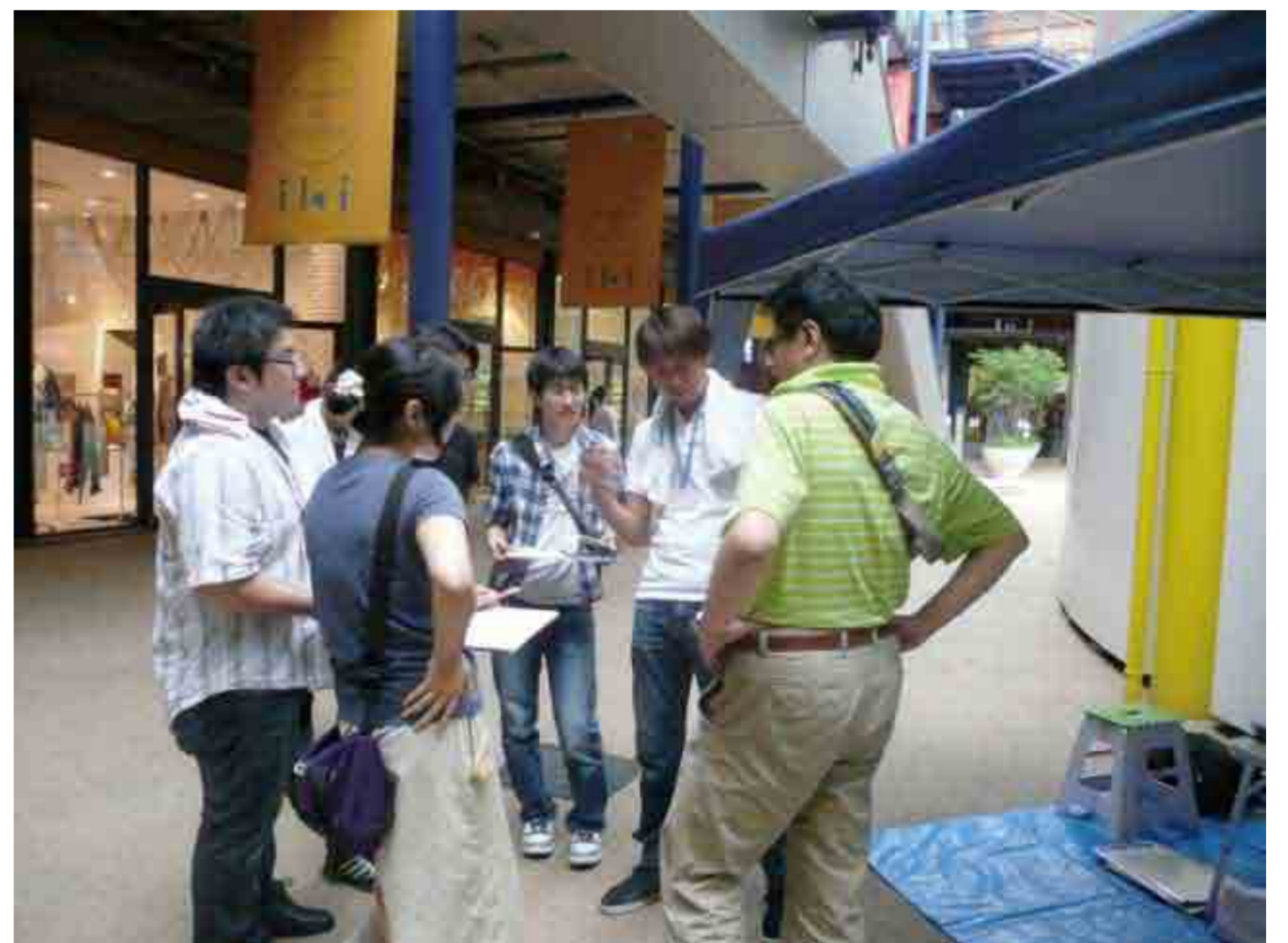
打ち合わせ後、いざ、調査へ！