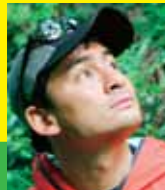
アルピニスト 野口健

2008年から2012年は、京都議定書の約束期間となっており、その間に日本は温室効果ガス排出量を、基準年の排出量から6%削減する必要があります。達成にむけた想いを胸に、京都市役所前から、円山公園音楽堂までをパレードします。