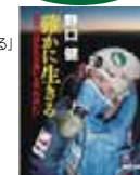
着書「確かに生きる」