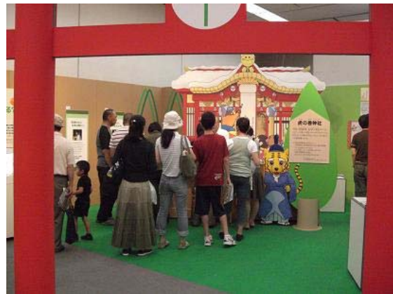
にぎわう虎の巻神社（最後にエコ宣言！）