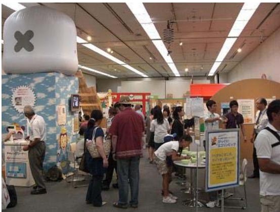
白熱する会場（エコリンピックも開催）